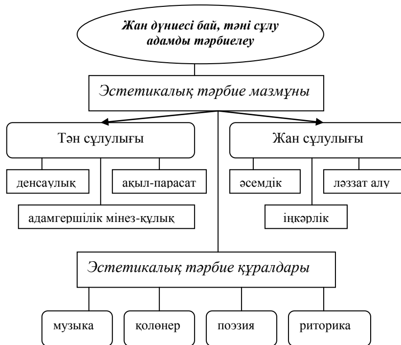
Сурет -3 - әл-Фараби бойынша эстетикалық тәрбиенің мәні