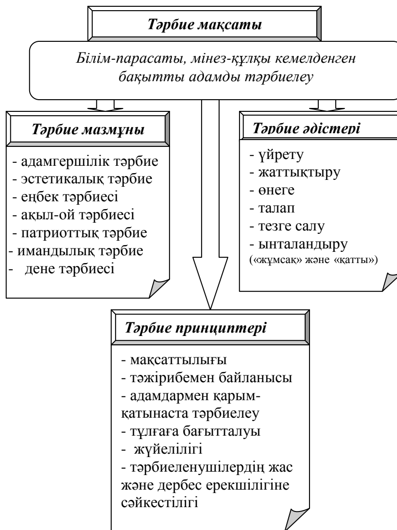
Сурет 2 - әл-Фараби тәрбие теориясының мәні