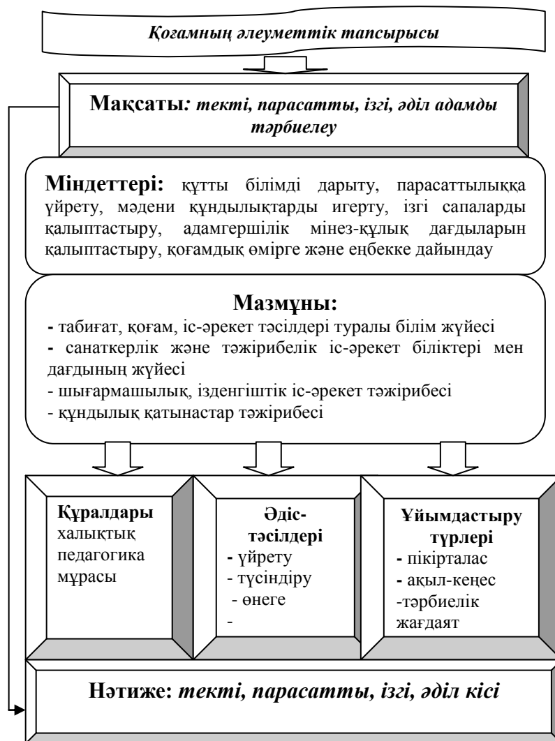
Сурет - 1 – «Құтты біліктегі» педагогикалық процесс құрылымы