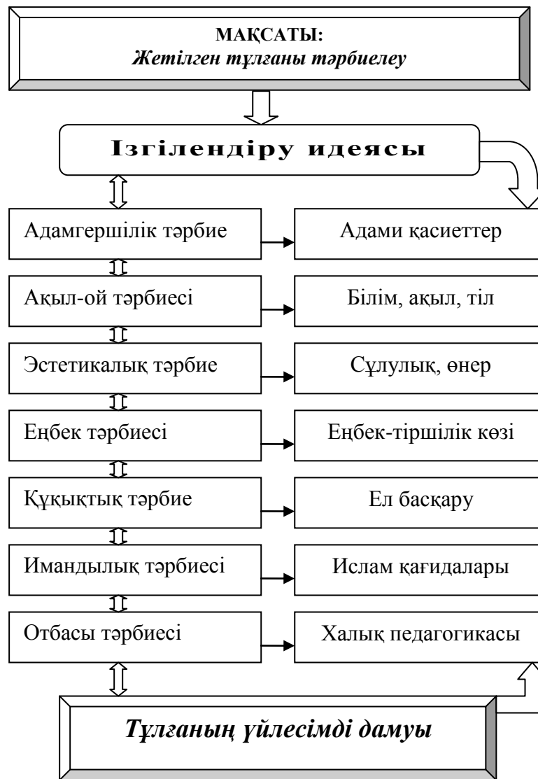
Сурет 4 - Ж.Баласағұнидің тәрбие теориясы